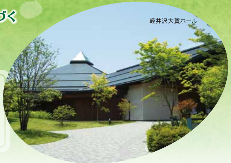
軽井沢大賀ホール

「ボランティア全国フォーラム軽井沢2018」では、この思いを参加者のみなさんと共有し、ともに考え、全国に発信していきます。みなさんの参加をお待ちしています!